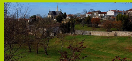
Vallon du Riel